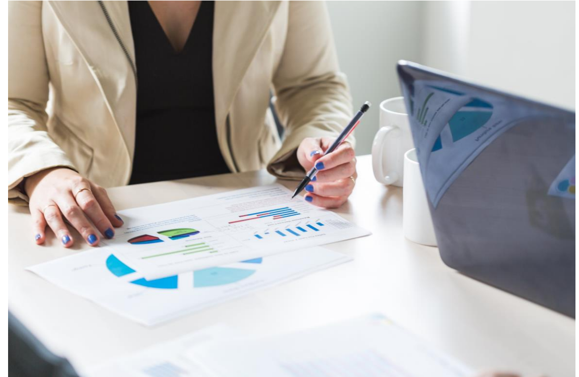
Definizione di una procedura che consenta di accedere ad una convenzione B2B con Trenitalia e Italo

Censimento , metodologicamente condiviso e con l'idea di creare una serie storica, finalizzato a valutare l'impatto in termini di performance delle università italiane. Questo vuole essere uno strumento valutativo da dare in mano ai mobility manager per un confronto interno ed esterno.